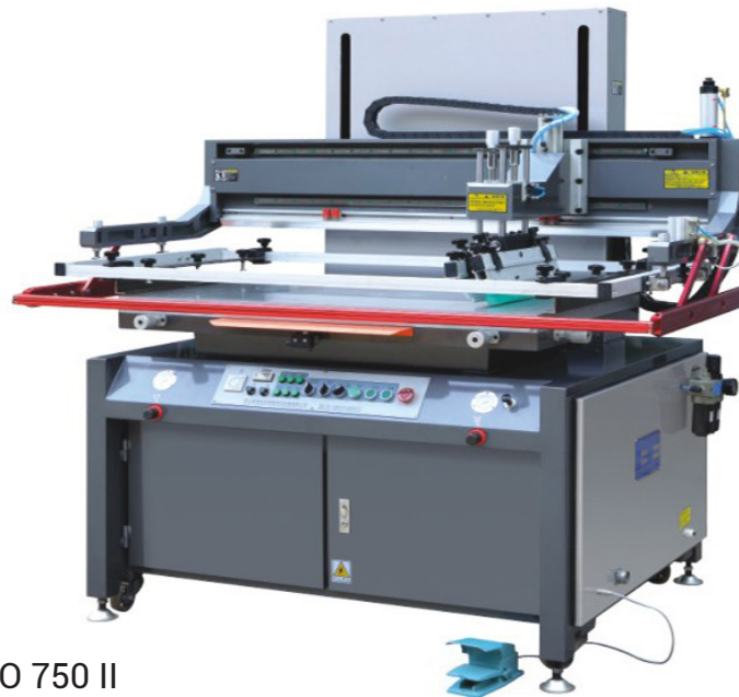
Presse sérigraphique JINBAO 750 II